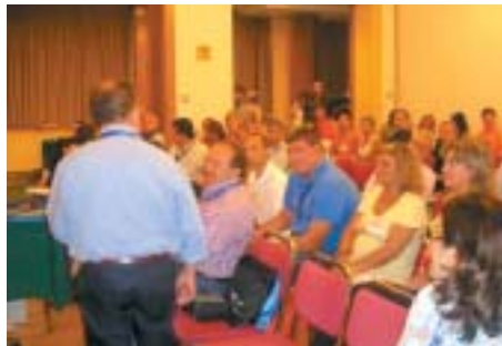
I delegati durante le operazioni di voto

Altre variazioni statutarie potranno essere proposte dai congressisti ed elaborate da un gruppo di lavoro per poi trovare accoglimento nelle delibere di questo organo altamente rappresentativo.