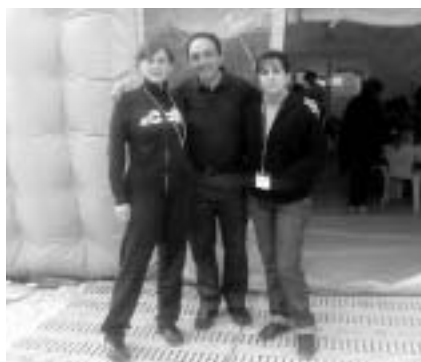
Tre colleghi di religione nella scuola del campo

Nel nostro vagare col ludo-bus, fuori di Bagno, visitiamo anche altri campi e incontriamo maestre e scuo-