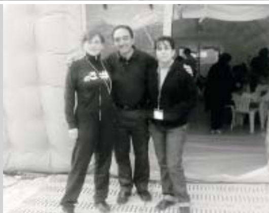
Tre docenti di religione all'ingresso di una scuola-tenda.